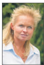
Von Yvonne Hinz

Ein Psychogramm zu erstellen, fällt in diesem Fall nicht schwer: Es muss sich um einen Menschen handeln, der kein Freund der großen Worte ist. Eher der feinen Taten. Und es dreht sich um eine Person, die zweifelsfrei kein Fan von Online-Banking ist.