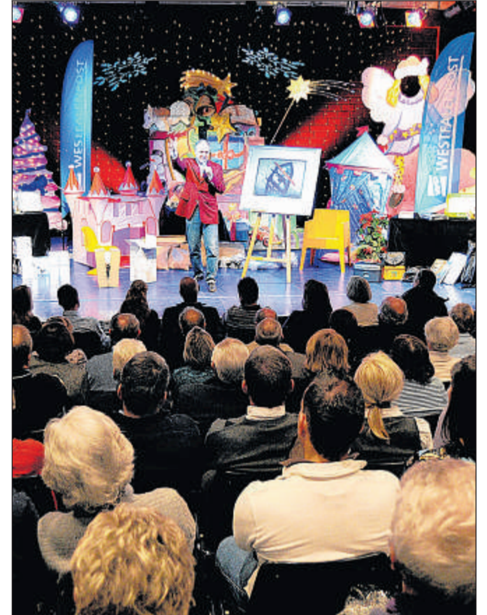
Die WP-Versteigerung findet diesmal nicht im Lutz-Theater, sondern im Sparkassen-Karree statt.

HAGEN-MITTE. (yh) Der Countdown läuft - am morgigen Sonntag ist es soweit: Zur großen WP-Benefiz-Versteigerung erwarten wir 300 Gäste. Begrüßt werden die Besucher vor dem Sparkassen-Karree vom Arcadeon-Team, das seinen schicken Party-Anhänger präsentiert. Die mobile Grill-Station inklusive Getränken und Speisen nach Wahl für 1000 Euro wird später von Werner Hahn vom Theater für einen Tag (z.B. für eine Betriebsfeier, ein Jubiläum oder ein Sommerfest) versteigert. Ab 11 Uhr weht der Duft frischer Waffeln durchs Karree, und beim Schnäppchenmarkt können die Gäste Präsente für kleines Geld (Bücher, Parfümerieartikel, Accessoires) kaufen. Um 12 Uhr steigt die Auktion, bei der ein wunderschönes Horst-Beking-Bild, wertvoller Schmuck, zwei Riesen-Teddys und eine Rentier-Familie aus Reisig unter den Hammer kommen. Gutscheine für Gruppen-Ausflüge, Wanderungen, Kindergeburtstage u.v.m. werden ebenfalls für den guten Zweck versteigert.