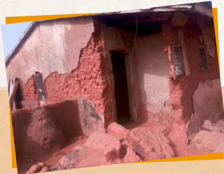
DAS EINSTURZGEFÄHRDETE KINDERHEIM VON YAMAH

Das Kinderheim in Yamah, in dem zur Zeit 28 Kinder leben, ist extrem baufällig und einsturzgefährdet. Die Kinder schlafen auf dem nackten Lehm Boden, es sind keine sanitären Anlagen vorhanden und es regnet hinein. Hier müssen wir dringend helfen und möchten das Kinderheim in 3 Stufen ausbauen. Für die 1. Stufe, in der nun 2 Schlafräume und ein Toiletten- und Duschräum gebaut werden, konnten wir bereits einen Spender finden. Um das Kinderheim jedoch nachhaltig zu verbessern, ist der weitere Ausbau dringend erforderlich. Es fehlen noch weitere Schlafräume, auch für die Heimleiter, Toiletten- und Duschräume. Außerdem, ganz wichtig, Betten für die Kinder. Zusätzlich möchten wir noch eine Mais- und Erdnussfarm anlegen, um die Region unabhängiger von Lebensmittelspenden zu machen.