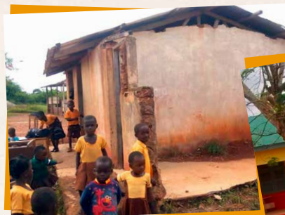
OBEN LINKS: DER EINSTURZGEFÄHRDETE REST DES ALTEN KINDERGARTENS RECHTS: DER NEUE KINDERGARTEN

... damit wir auch in weiteren Dörfern Schulen und Kindergärten bauen können. Denn Bildung ist der Schlüssel zu einem selbstbestimmten Leben!