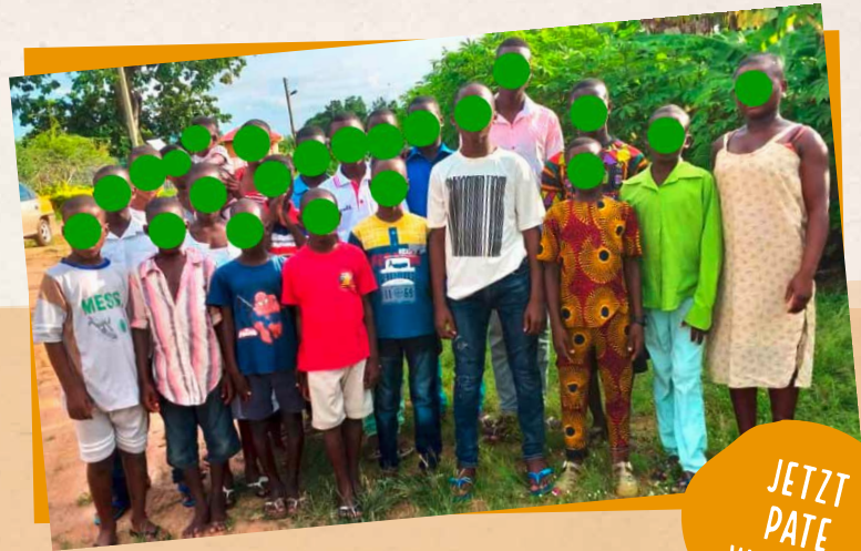
DIE AUS DER SKLAVEREI GERETTETEN KINDER VOM VOLTASEE