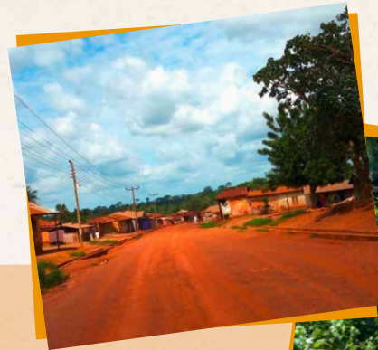
OBEN: DAS DORF KORKYIKROM RECHTS: DIE WASSER- STELLE IN KOR KYIKROM