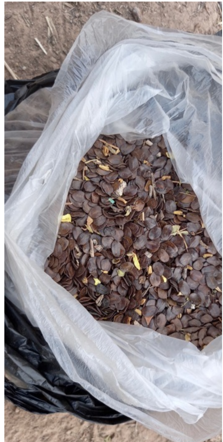
Akazien-, Cashew- und Neemtrees Samen