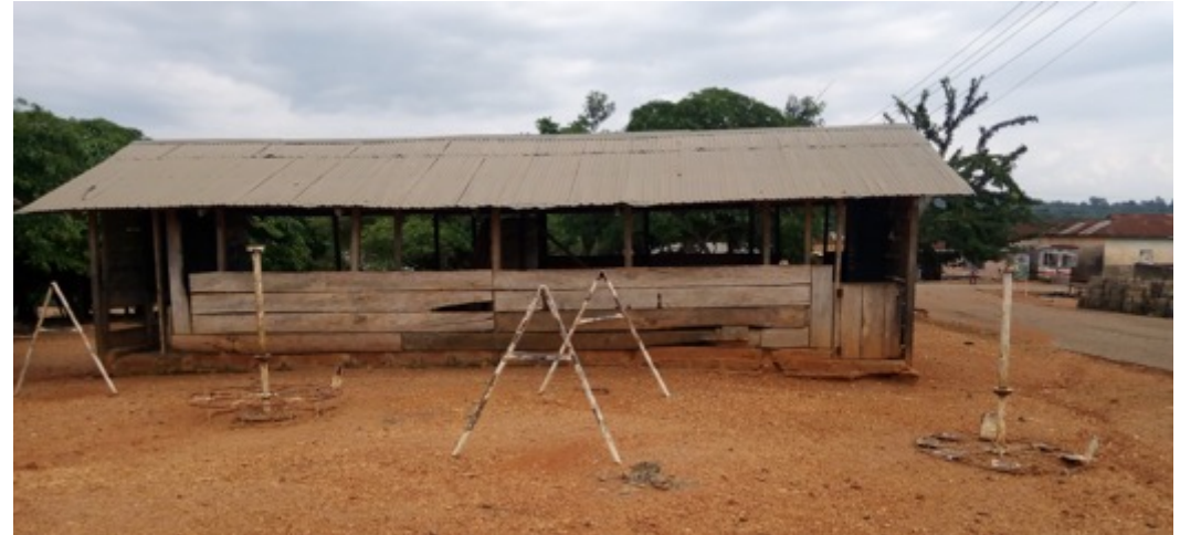
Der alte Schuppen vorher, in dem die Schüler untergebracht waren.

Denn neben dem Bau eines neuen Schulgebäudes mit hygienischen Toiletten und einer eigenen Wasserversorgung, werden hier in der Zukunft auch Schulungen für Mütter und Familien im Rahmen von Aufklärungskampagnen stattfinden (Malariaprävention, Säuglings- und Kindersterblichkeit, Müttersterblichkeit, Prävention von Teenagerschwangerschaften, Hygiene) stattfinden. (Förderer: Daimer ProCent)