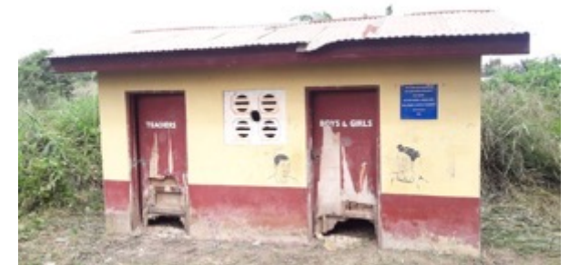
Das alte Toilettenhäuschen war stark baufällig.