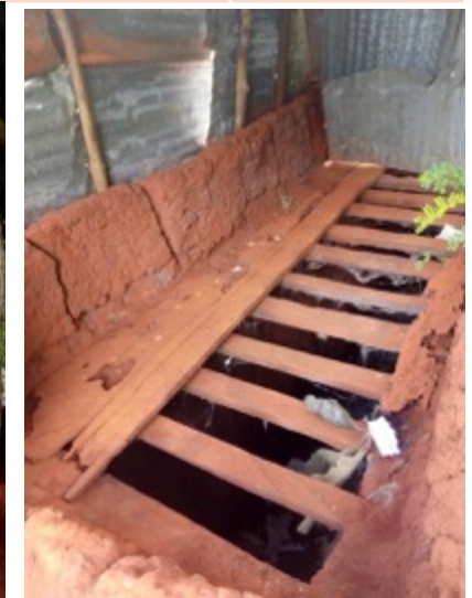
Dieser Verschlag mit Latrine diente den Schülern als Toilette. Besonders für die Mädchen war dieser Zustand unerträglich!