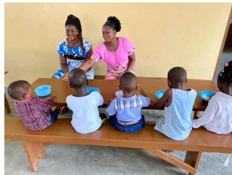
Die Kleinsten im Kinderheim