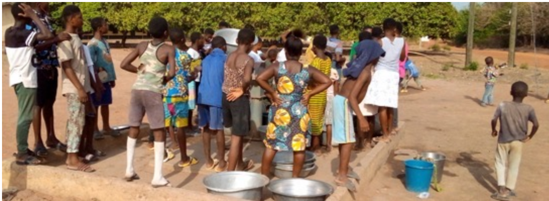
Banda Distrikt: Für die vielen Menschen gab es nur wenige oder gar keine Brunnen. Die Menschen mussten ihr Wasser aus verkeimten Flüssen oder Bächen holen.