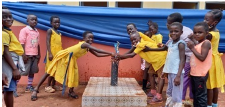
Jetzt gibt es hier saubere Toiletten und einen eigenen Brunnen. Die Freude ist groß!