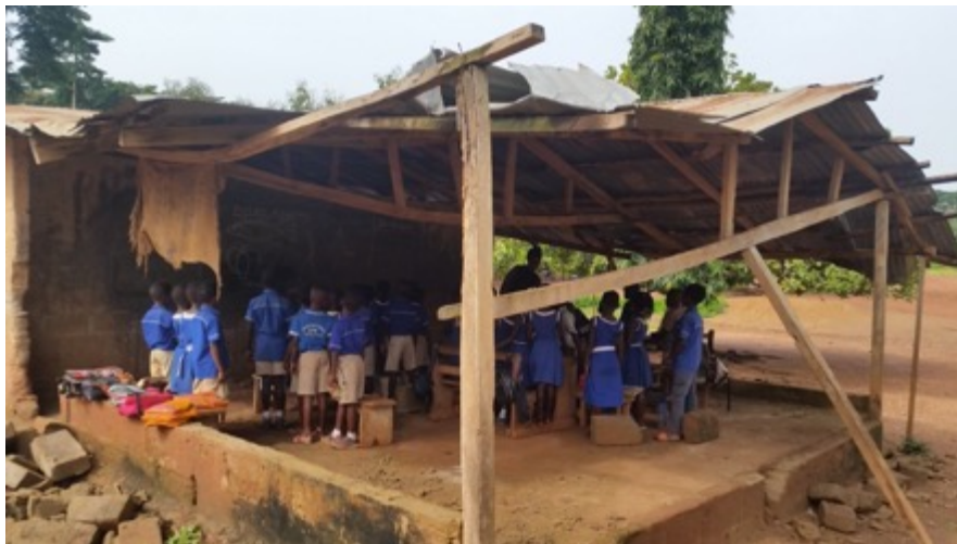
In diesem baufälligen Verschlag sind die Kindergartenkinder in Morle zur Zeit noch untergebracht.