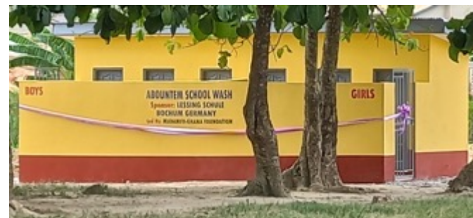
Das neue Toilettenhäuschen