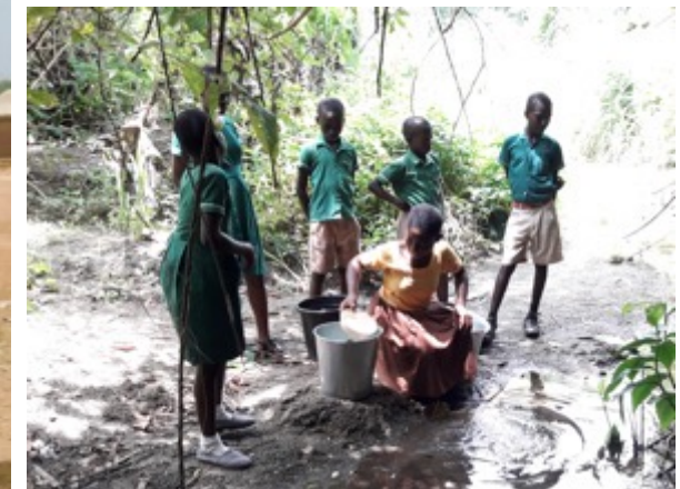
Kinder beim Wasserholen aus verunreinigten Bächen oder Wasserlöchern.