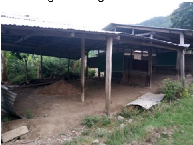
In solchen Schuppen wurden die Kinder unterrichtet. Effektives Lernen war so nicht möglich.

Der Bau eines neuen Schulkomplexes mit einer eigenen Wasserversorgung und hygienischen Toiletten führt zu einer nachhaltigen Lösung der Problematik.