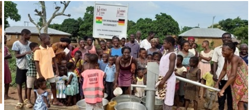
Banda Distrikt: Durch den Bau von 5 neuen Brunnen wurde die Situation entschärft und allen Bewohnern Zugang zu sauberem Trinkwasser ermöglicht.