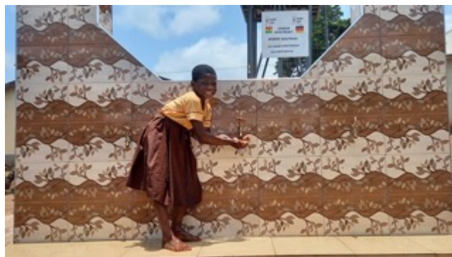
Auch in Aboa u. Adiorkor muss das Wasser nun nicht mehr aus dem Fluss geholt werden.