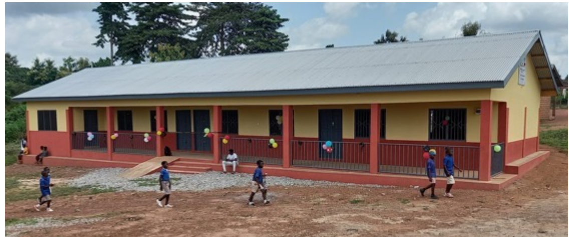
Der neue Kindergarten. Die Freude ist groß! Hier macht das Spielen und Lernen Spaß!