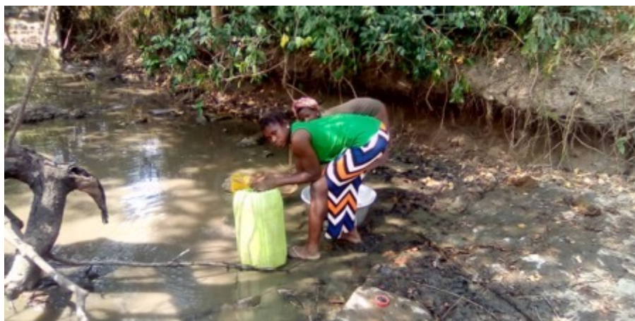
Frauen beim Wasserholen am Fluss in Yawkuma Kwadenden.