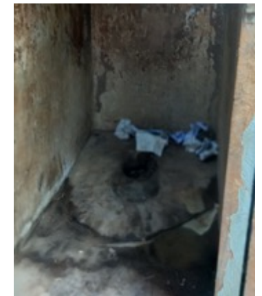
Der ehemalige Latrinenblock – Baufällig und stark verschmutzt.