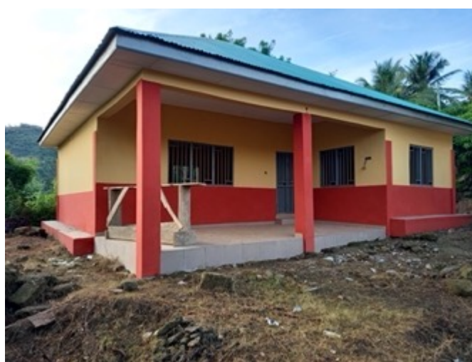
Neuer Computerraum in Apewu