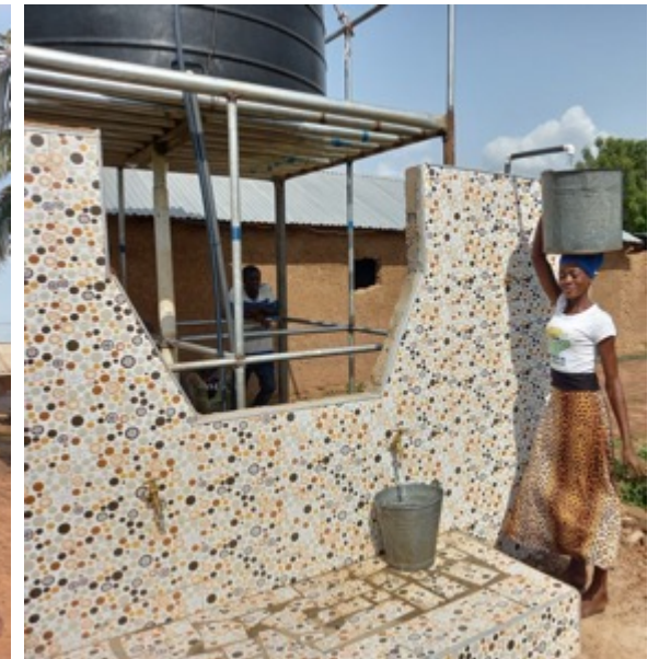
Jetzt gibt es hier genug sauberes Wasser für alle Bewohner.