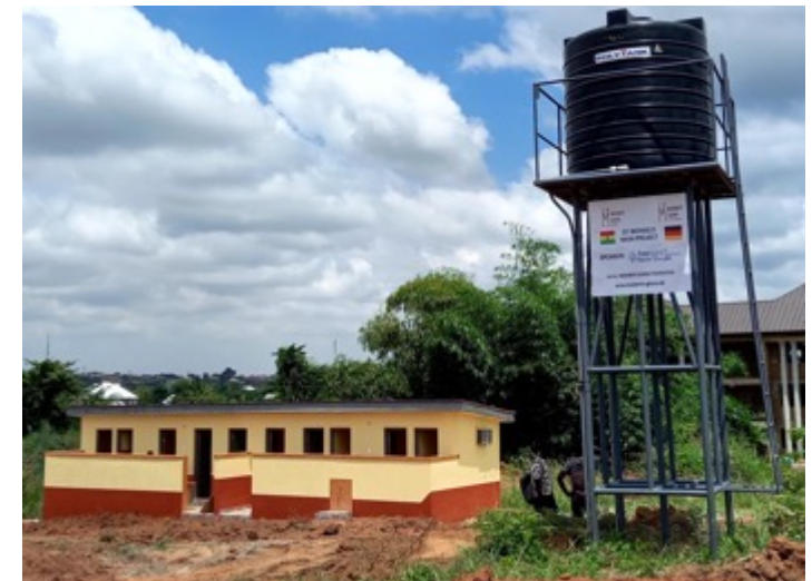
Jetzt gibt es eine moderne Toilettenanlage und eine mechanisierte Wasserversorgung.