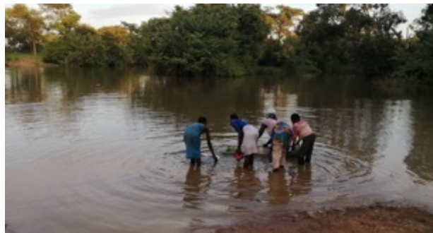
Auch in Tiya und Dama Nkwanta war die einzige Wasserquelle ein Fluss. Krankheiten waren so vorprogrammiert.