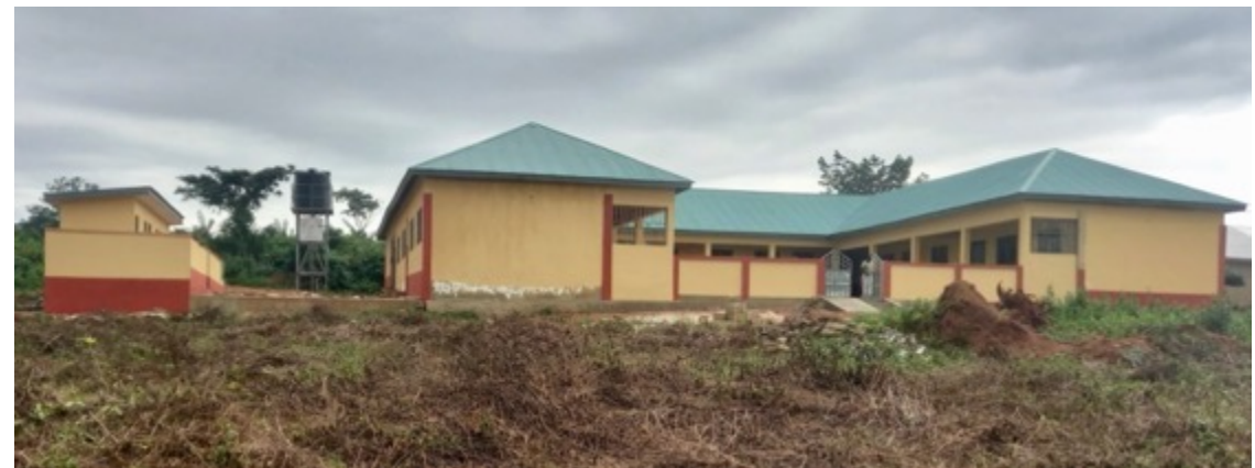
Das neue Schulgebäude