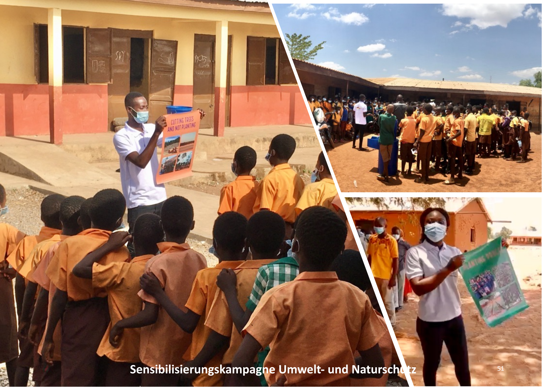
Sensibilisierungskampagne Umwelt- und Naturschutz