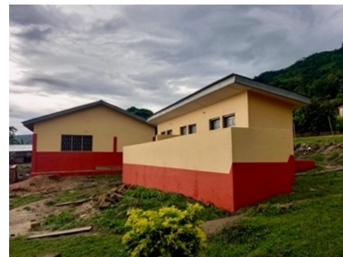
Neues Schulgebäude mit Toiletten in Essaase 13