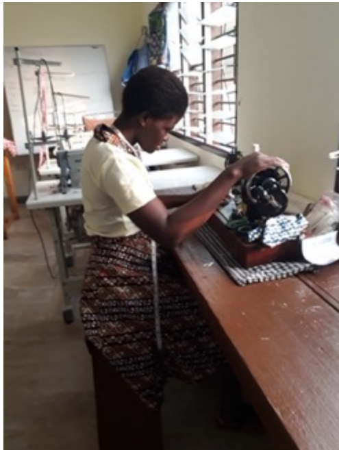
Auszubildende in einer Schneiderei

In 2021 konnten wir durch unser Stipendienprogramm 35 Studenten und Schülern einen Schul- oder Universitätsbesuch oder eine Ausbildung ermöglichen.