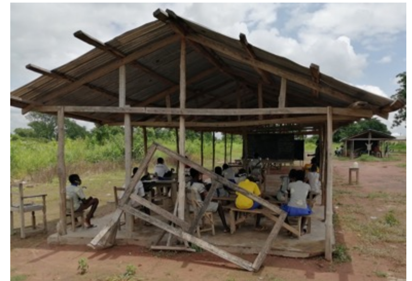
Situation vorher (oben) und nachher (unten)

Mit einem neuen Schulgebäude, mit 6 voll ausgestatteten Klassenzimmern, einem Lehrerzimmer, Büro u. Lagerraum sowie hygienischen Schultoiletten und einer eigenen Wasserversorgung möchten wir gemeinsam mit FLY & HELP diese Zustände beenden und Schülern und Lehrer ein angemessenes und menschenwürdiges Lernumfeld schaffen.