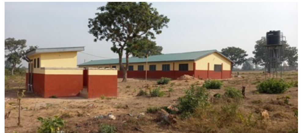
Bild oben: Situation vorher; Bild unten: Das neue Schulgebäude mit Toilettenhäuschen und Wassertank