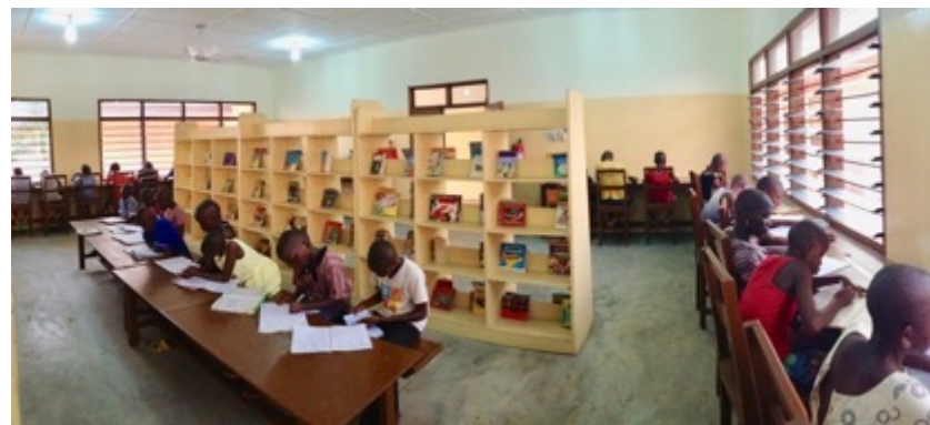
Schüler beim gemeinsamen Erledigen der Hausaufgaben