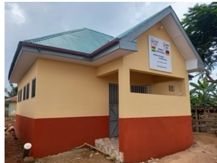
Jetzt steht dort dieses schöne Toilettenhäuschen mit hygienischen Toiletten und Handwaschbecken.