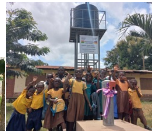
Die Freude über die neuen Toiletten und die Trinkwasserversorgung ist riesig!