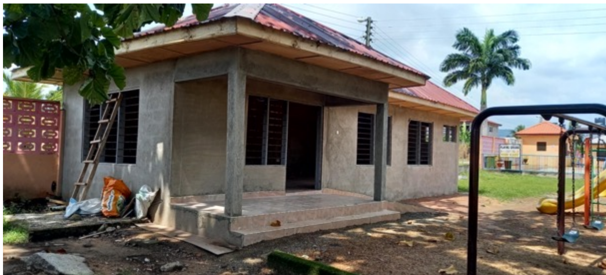
Der neue Kindergarten in Ho – Stand November 2021

In letzter Zeit werden immer mehr Kleinkinder und sogar Säuglinge von der Polizei und dem Ministerium of Social Welfare in unsere Obhut übergeben. Kinder, die schwer misshandelt und zum Teil auf Müllkippen gefunden wurden. Um auch dieser Altersgruppe gerecht zu werden, haben wir mit Hilfe von Sternstunden e.V. unser Kinderheim um einen Kindergarten, kleinkindgerechte Ausstattung und Spielgeräte und eine höhere Absicherung um das Grundstück erweitert.