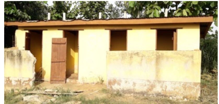
Das Toilettenhaus vorher: Baufällig, schmutzig und ohne Türen.

Durch den Bau einer modernen Toilettenanlage und einen mechanisierten Brunnen stehen nun allen Studierenden und Lehrern hygienische Toiletten mit Handwaschbecken und ausreichend sauberes Trinkwasser zur Verfügung.